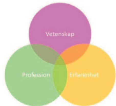
Bild. Evidensbaserad praktik

Varje tema inleds med att du som cirkelledare berättar kort om temat. Temapresentationen är till för att väcka tankar för vidare reflektioner. I Trygghet Ur Stöd har vi använt cirka 5 minuter, men du väljer din egen tidsomfattning.